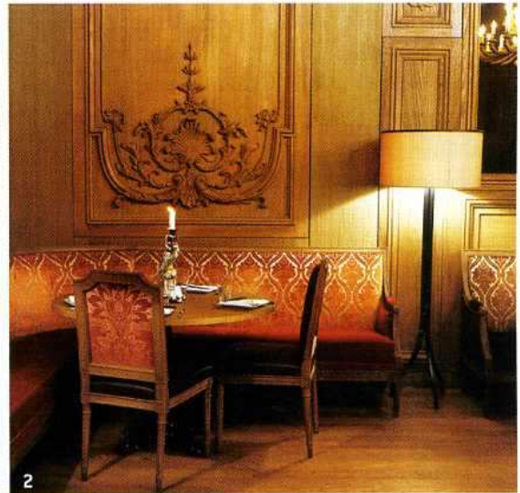
boiseries Louis XV et sièges style XVIII e . 3: La gigantesque salle à manger, son immense table, ses lustres baroques en bois sculpté.